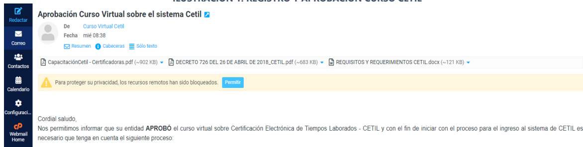
ILUSTRACIÓN 1: REGISTRO Y APROBACIÓN CURSO CETIL

Una vez aprobado este curso virtual, se nos informa que el siguiente paso es: